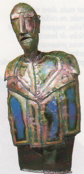
Jean-Nicolas Craps, buste d'homme en tôle colorée , 1997.

Contrast Gallery, rue Ernest Allard 21 à 1000 Bruxelles. Tél. et fax 02/512.98.59. Ouvert le lundi de 14h à 18h, du mardi au vendredi de 12h à 18h30, le samedi de 11h à 18h30 et le dimanche de 11h à 14h.